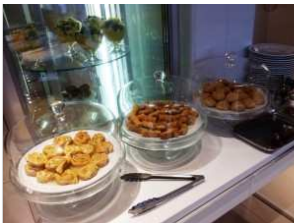
Pâtisseries et salades de fruits

originaires du Tibet ou des Philippines vous réservent un accueil d'une gentillesse exemplaire. L'hygiène est irréprochable. Le décor tout en faïence et boiserie marocaine dépayse mais se veut sans chi-chi. Seules les cabines semi-ouvertes pour le grand gommage sur carrelage peuvent gêner les plus pudiques. Le Hammam Pacha est exclusivement réservé aux femmes qui viennent se retrouver pour un moment de convivialité entre amies, entre mère et fille : nous vous conseillons d'éviter les samedis et dimanches pour plus de tranquillité. Un petit pot de crème à l'argan vous est offert. A la clé : peau douce, lumineuse, bien hydratée et une bienfaisante relaxation au cœur de Paris. Forfait éphémère à prix avantageux jusqu'au 21 mars 2017.