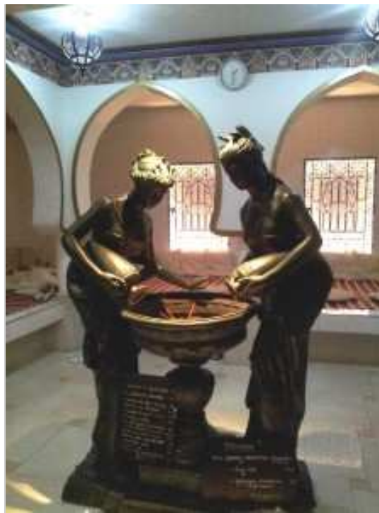
Les verseuses d'eau

toxines accumulées, nourrir votre peau desséchée, poussez la porte du Hammam Pacha de Paris. Un thé vert à la menthe servi avec le sourire devant une vidéo rappelant les précautions d'usage du sauna, hammam, marque une agréable transition entre l'agitation extérieure et votre immersion dans l'univers oriental.