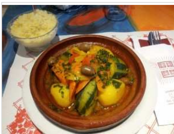
Tajine poisson

On peut prolonger ce rituel de bien-être à l'orientale en dégustant au restaurant typique attendant (peignoir autorisé) une authentique et copieuse Tajine maison (poulet,