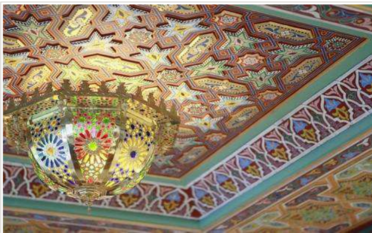
La décoration évoque une tradition marocaine chaleureuse et raffinée.