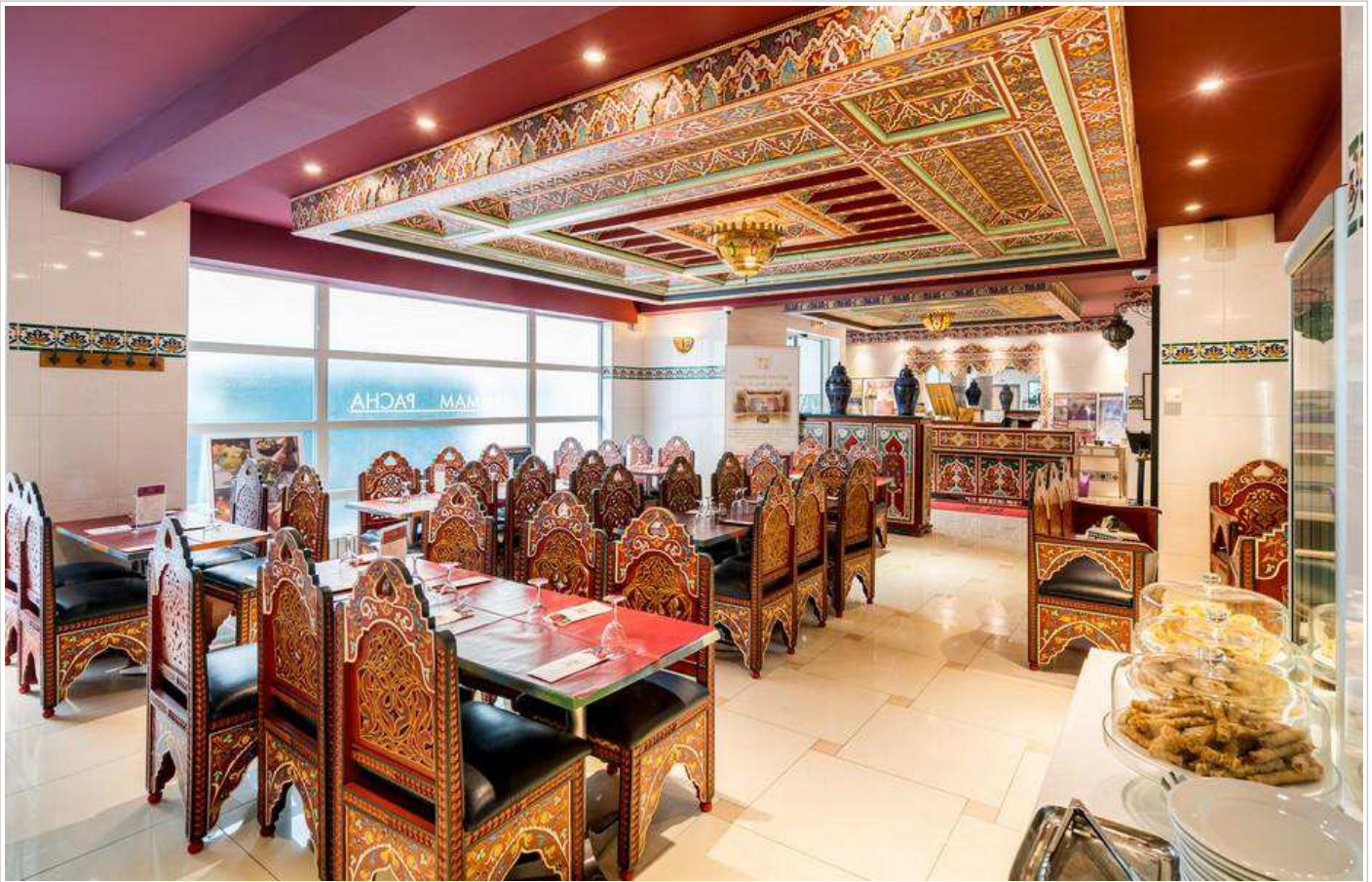
Le restaurant marocain après les soins...