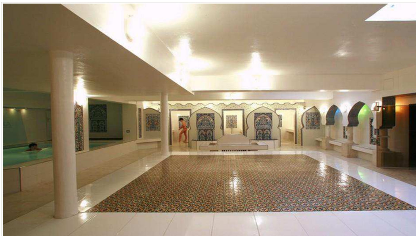
La grande salle tiède avec sa dalle centrale.