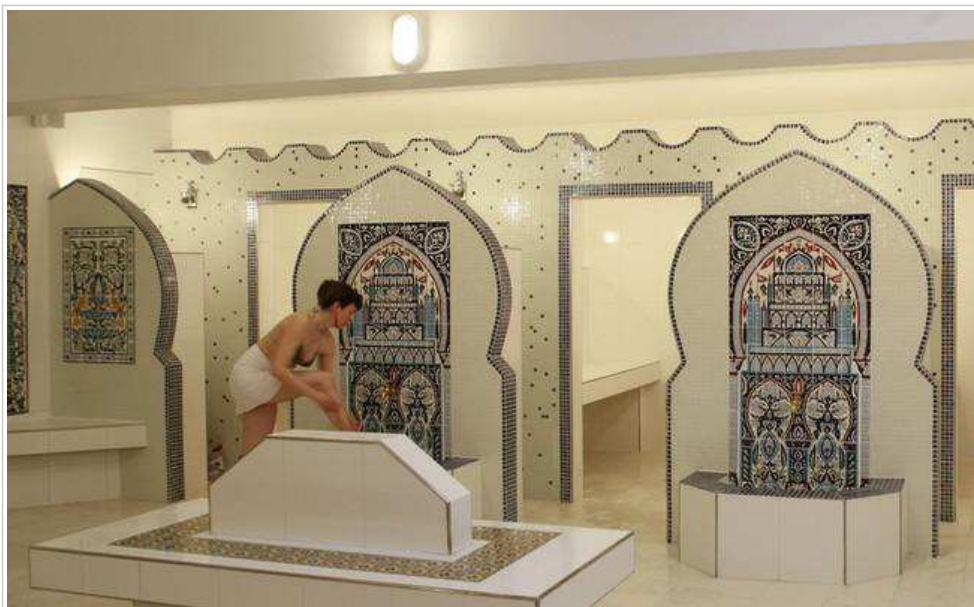
Après la douche on se dirige vers le hammam ou le sauna @ Le Pacha/Lindigomag